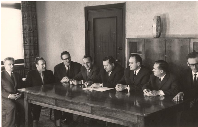
1 pav. 1965 m. KPI Rektorato posėdyje