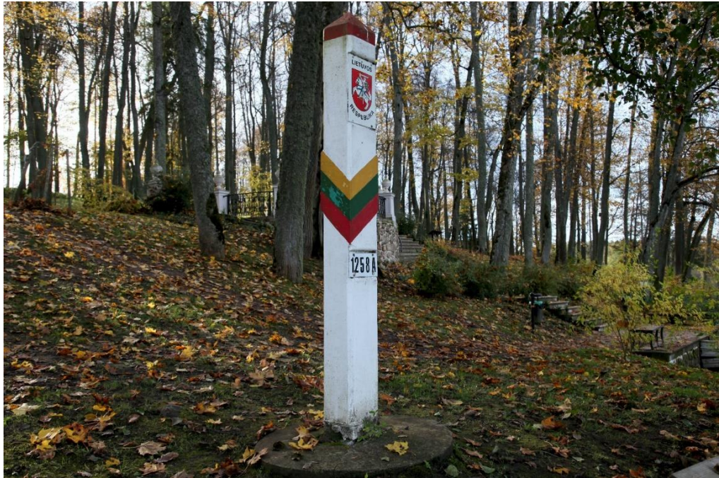
Ilgio ežeru eina Lietuvos-Latvijos siena. Pasienio stulpas ežero krante