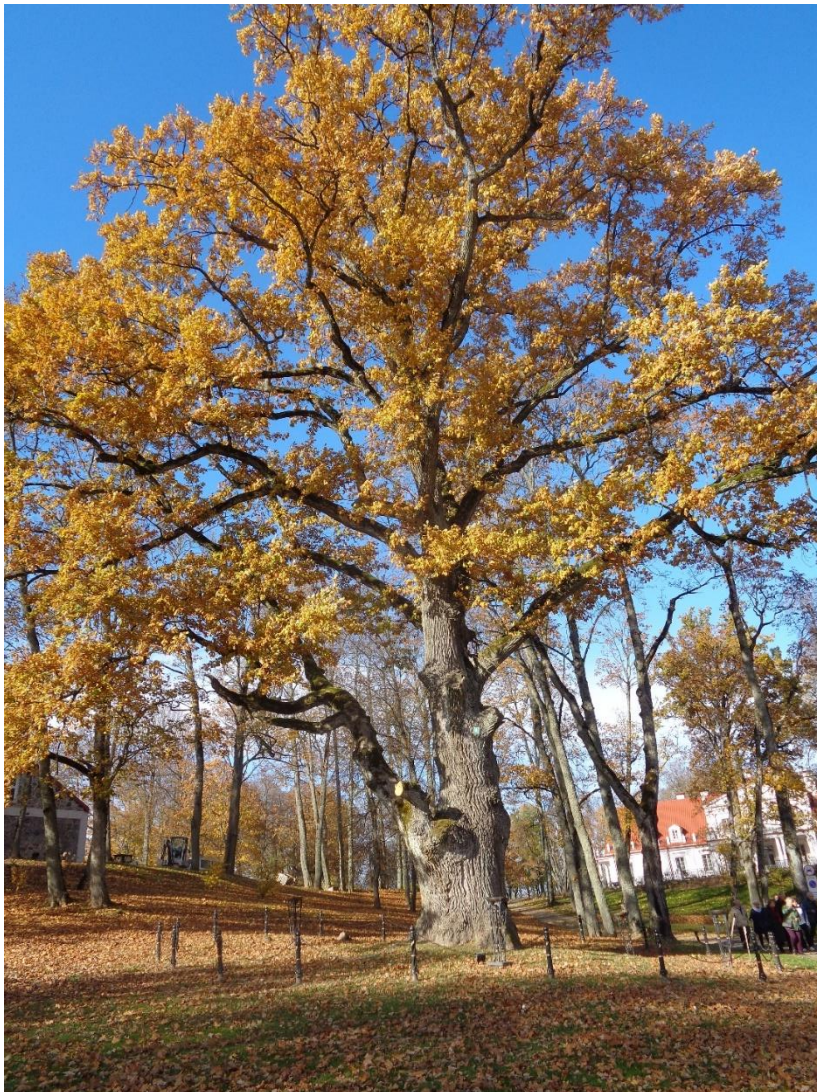
Dvare yra ir kitas istorinis Ažuolas. Manoma, kad jis pasodintas įkūrus dvarą, taigi jo amžius taip pat daugiau kaip 500 metai. Ažuolo apimtis - 6,3 m, skersmuo – 2 m, aukštis – 30,5 m.