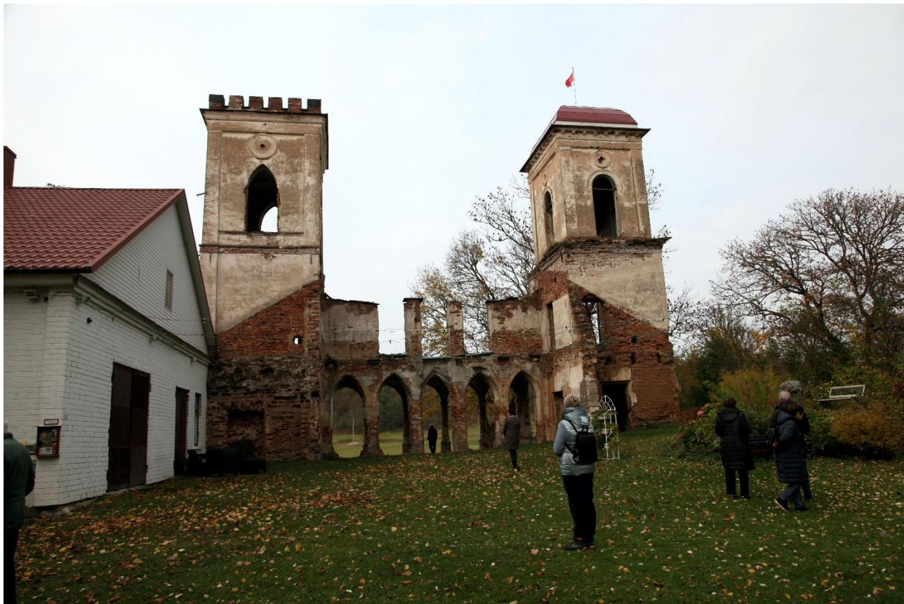
Palėvenės Komarų dvaro griuvėsiai, kairėje matyti suremontuota rūmų dalis