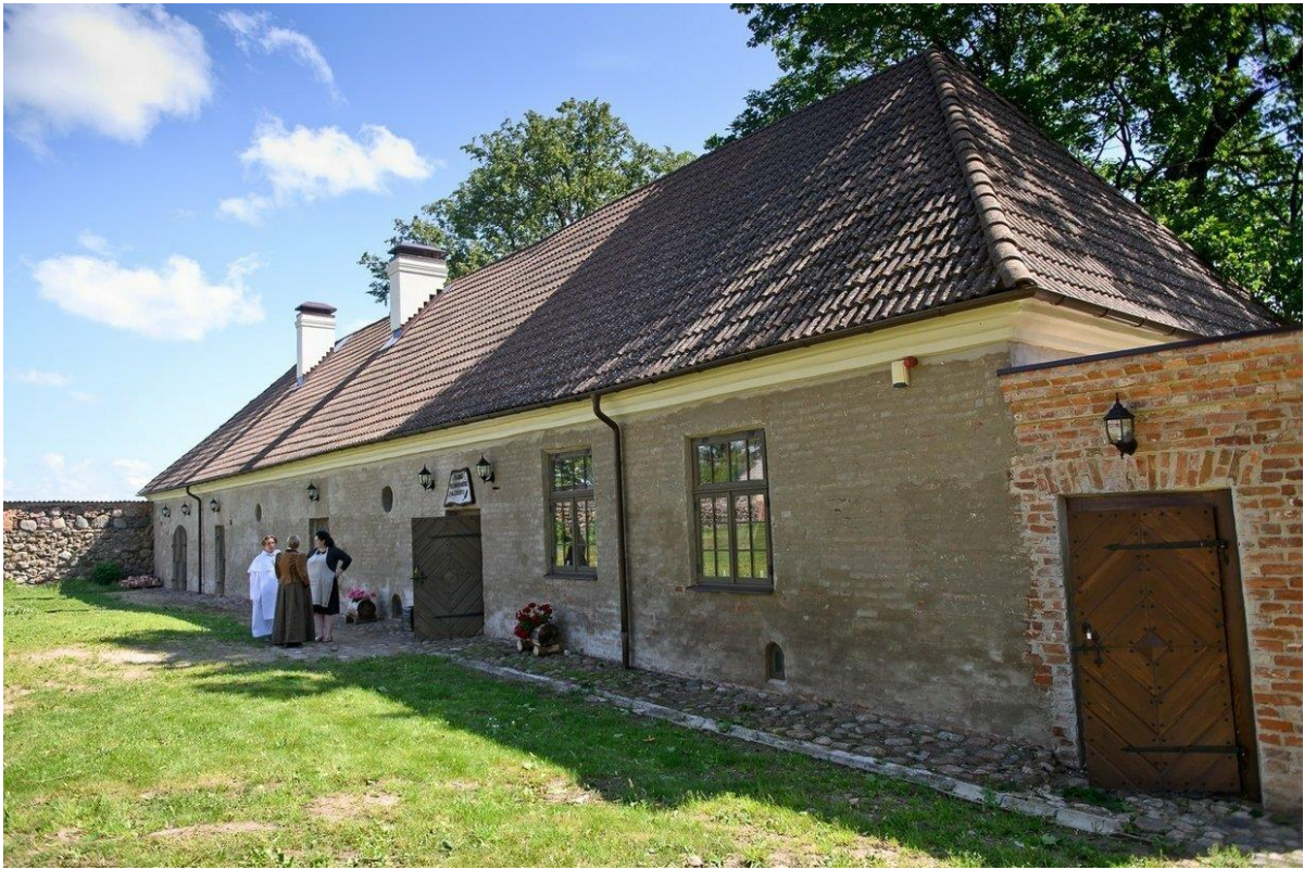
Vienuolyno svirnas atvertas turistams

Aplankėme vienuolyną. Čia vietos bendruomenės narė aprodė vienuolyno patalpas, papasakojo vienuolyno istoriją, apžiūrėjome vienuolyno rūsius.