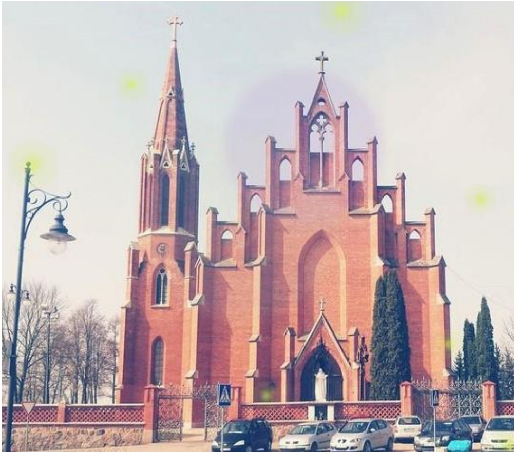
Rokiškio Šv. apaštalo evangelisto Mato bažnyčia