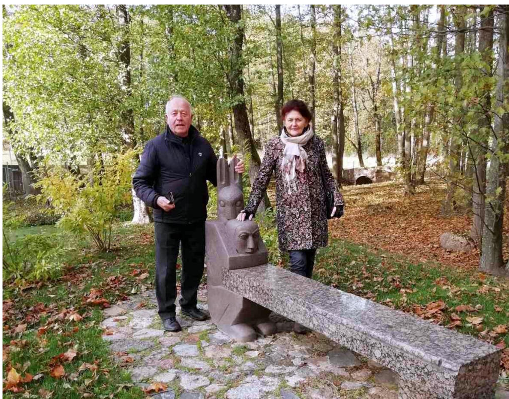
Suoliukas – zuikis gelbsti medžiotoją

Medžio pjūvį iliustruojančioje skulptūroje įtaisytos lentelės vaizduojančios, kokio storio buvo ąžuolas svarbiausių raktinių Lietuvos valstybei įvykių metu. Pvz., matome, kad kai buvo paminėtas 1009 metais Lietuvos vardas ąžuolas jau buvo įspūdingo storio.