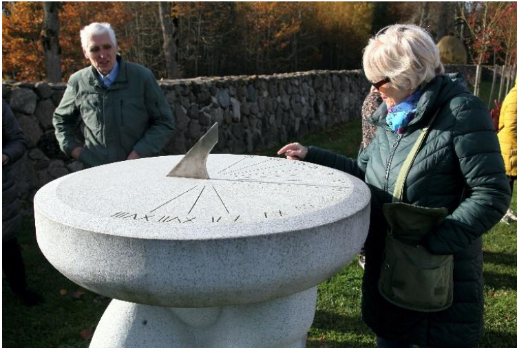
Saulės laikrodis visada rodo tikslų laiką