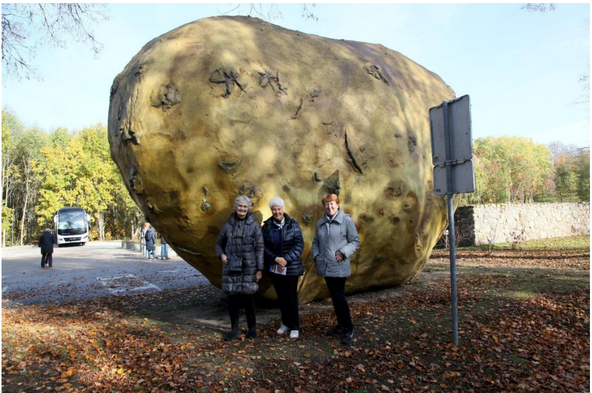
Didžiausia bulvė pasaulyje

auginama ir gaminama itin švari ir natūrali žemės ūkio produkcija. Važiuodami matėme karvių, avių bandas, vynuogių laukus. Dvaro produkcijos galima įsigyti ne tik Rokiškio rajono parduotuvėse, bet ir kituose miestuose, pvz., Kaune.