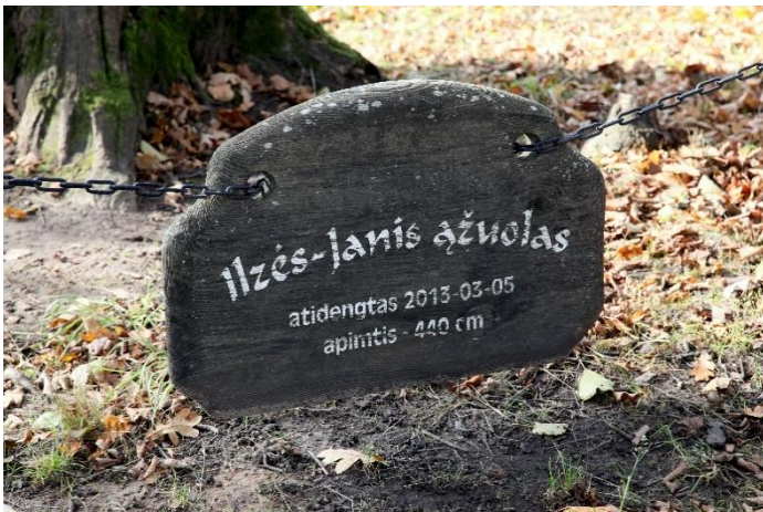
Meilēs salos āžuolas