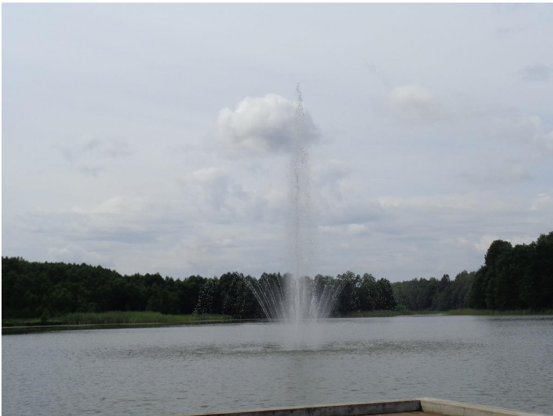
Šalia liepto į salą įrengtas fontanas