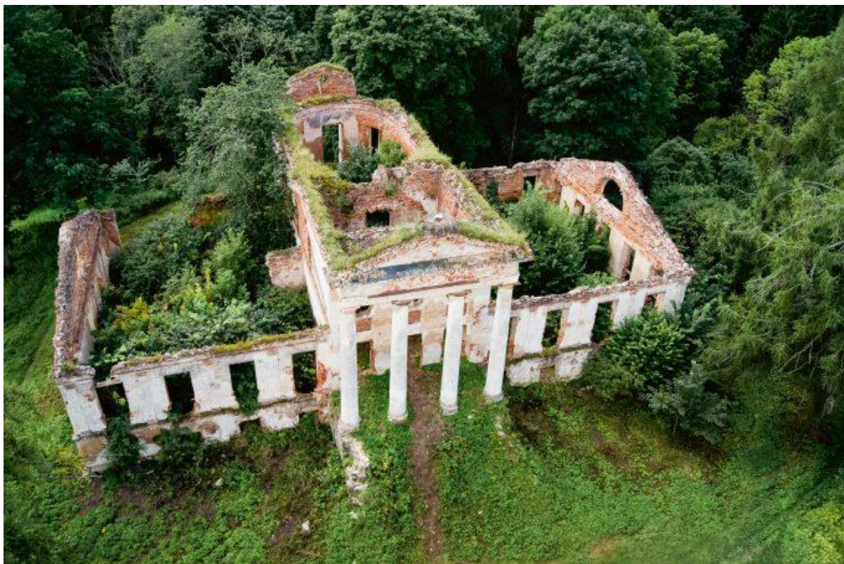
Onušio dvaro sodybos griuvėsiai

Internete radau žinutę, kad šių metų sausio 3 d. pasirašyta dvaro pardavimo sutartis, savininkas – fizinis asmuo, tačiau jo kontaktiniai duomenys neatskleidžiami.