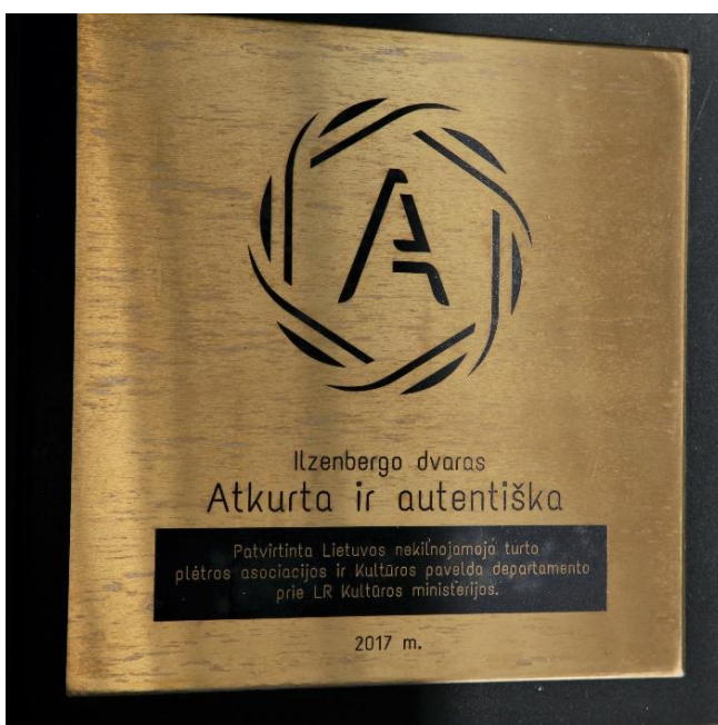
Pastato restauravimo autentiškumą patvirtinantis ženklas

Ekskursiją po dvarą baigiame apžiūrėdami rūmus. Rūmai restauruoti, atkurtas rūmų interjeras tačiau baldai neišliko. Jie atkurti dabartinių Lietuvos baldų meistrų pagal išlikusias nuotraukas, aprašus.