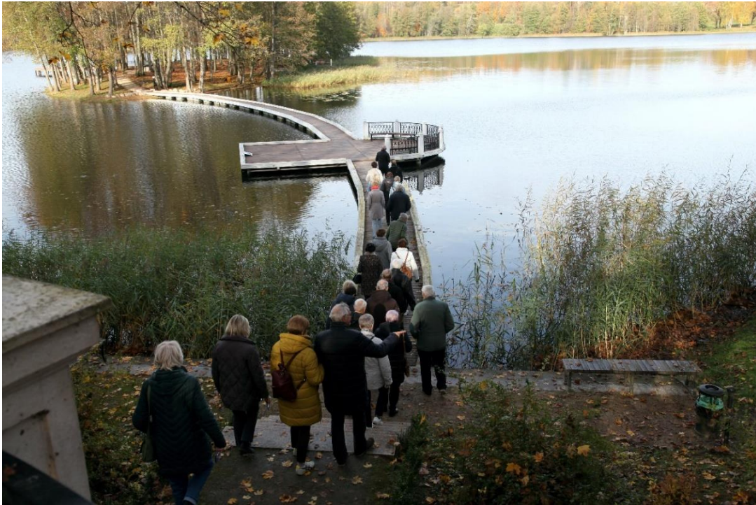
Lieptas į Meilės salą