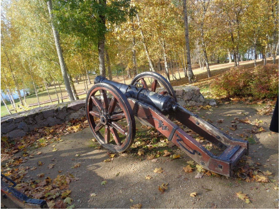
Švedų karus menanti patranka