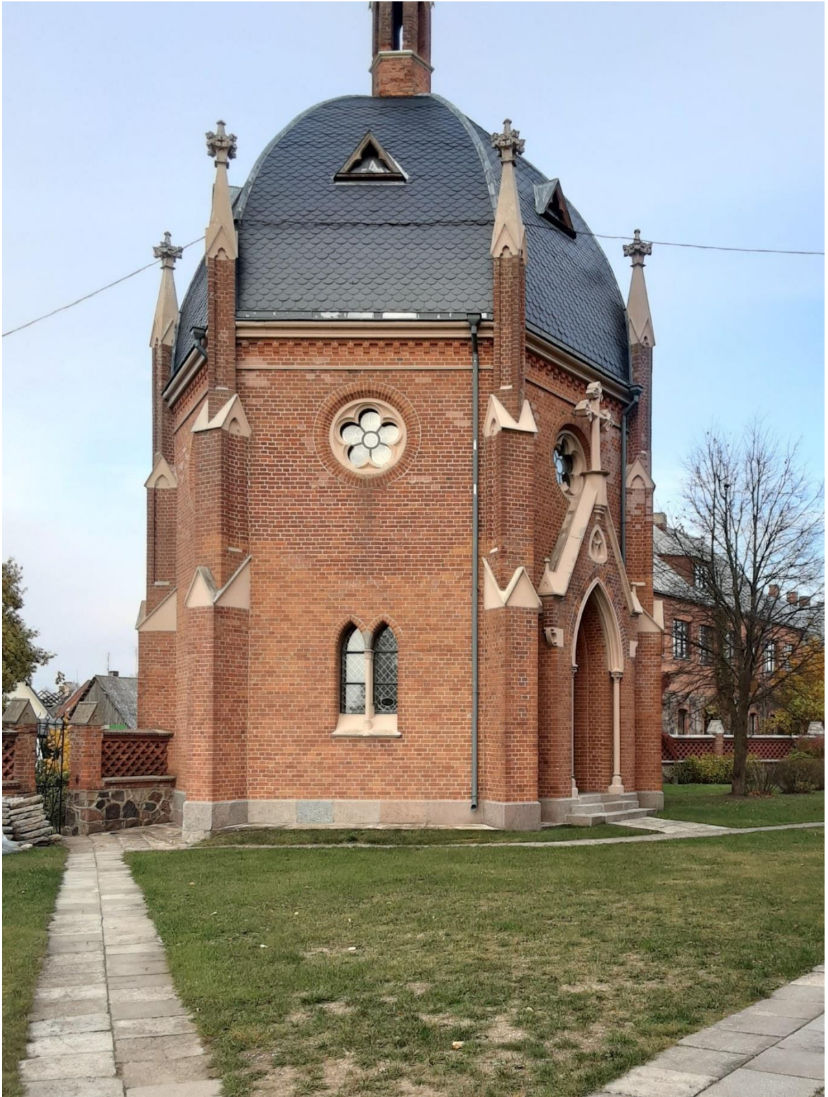
Šv. Juozapo koplyčia