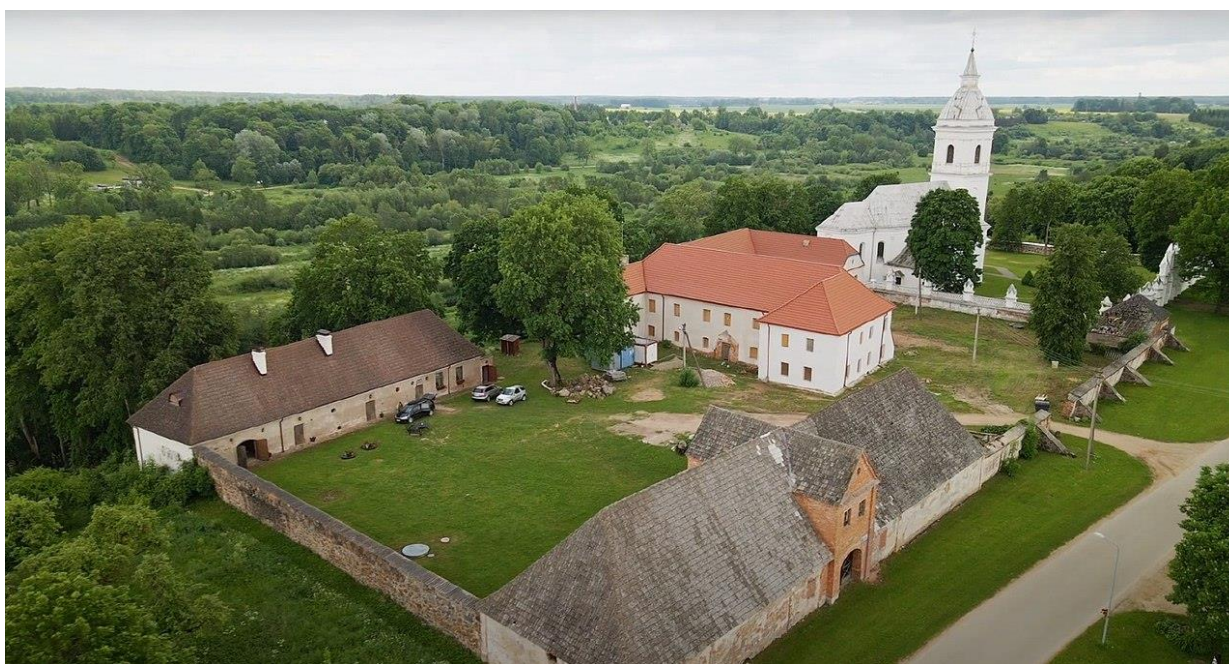
Palēvenės baņņyčios ir vienuolyno kompleksas