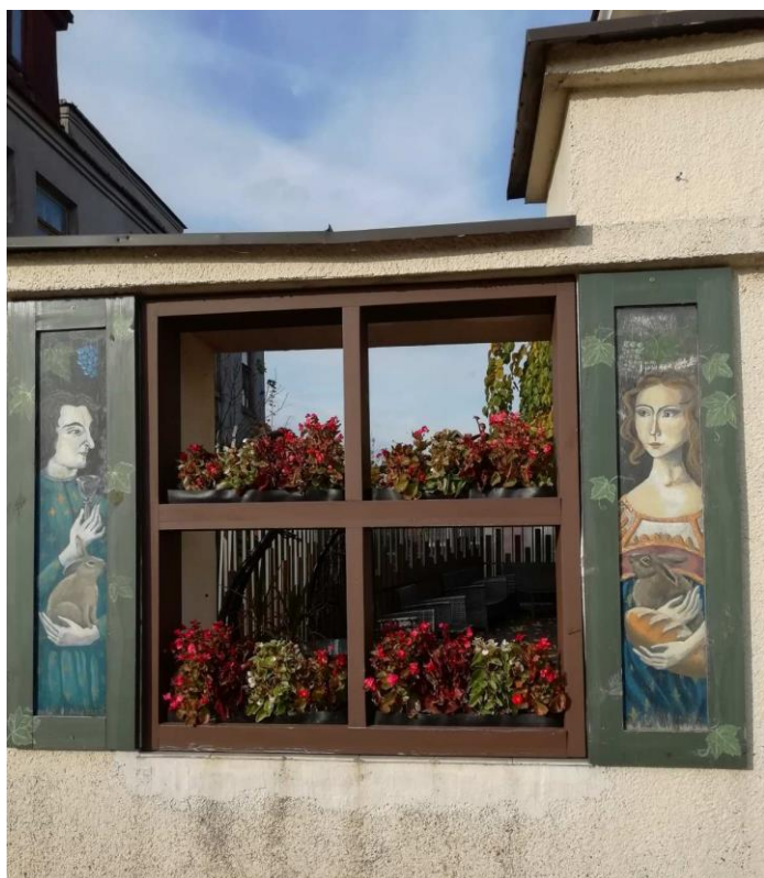
Grįžtame į Rokiškį.

Rokiškis be kitų įžymių objektų garsėja ir savo ypatingomis meniškėmis langinėmis.