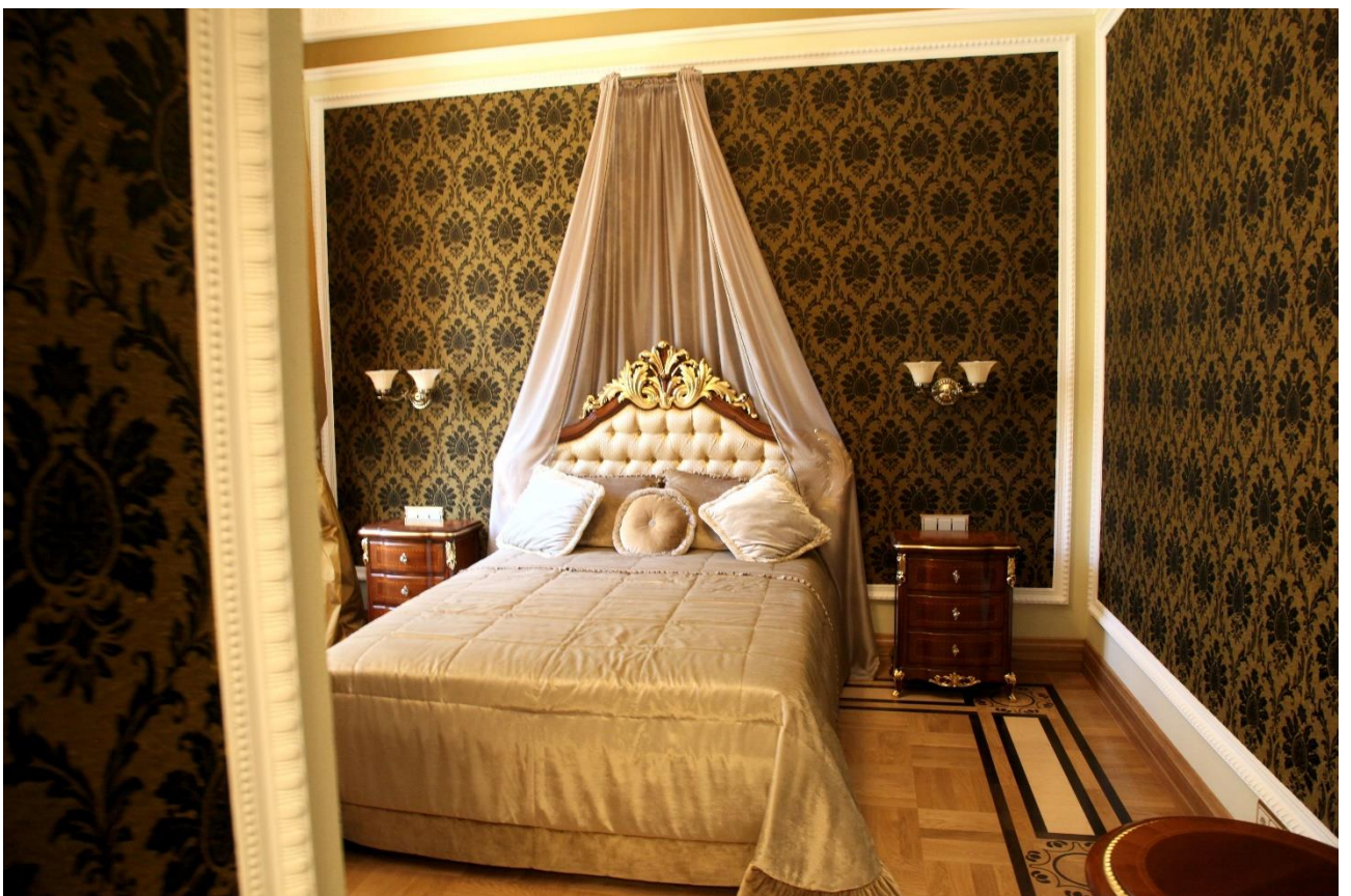
Ilzenbergo dvaro pastato ir dvaro rūmų interjero vaizdai