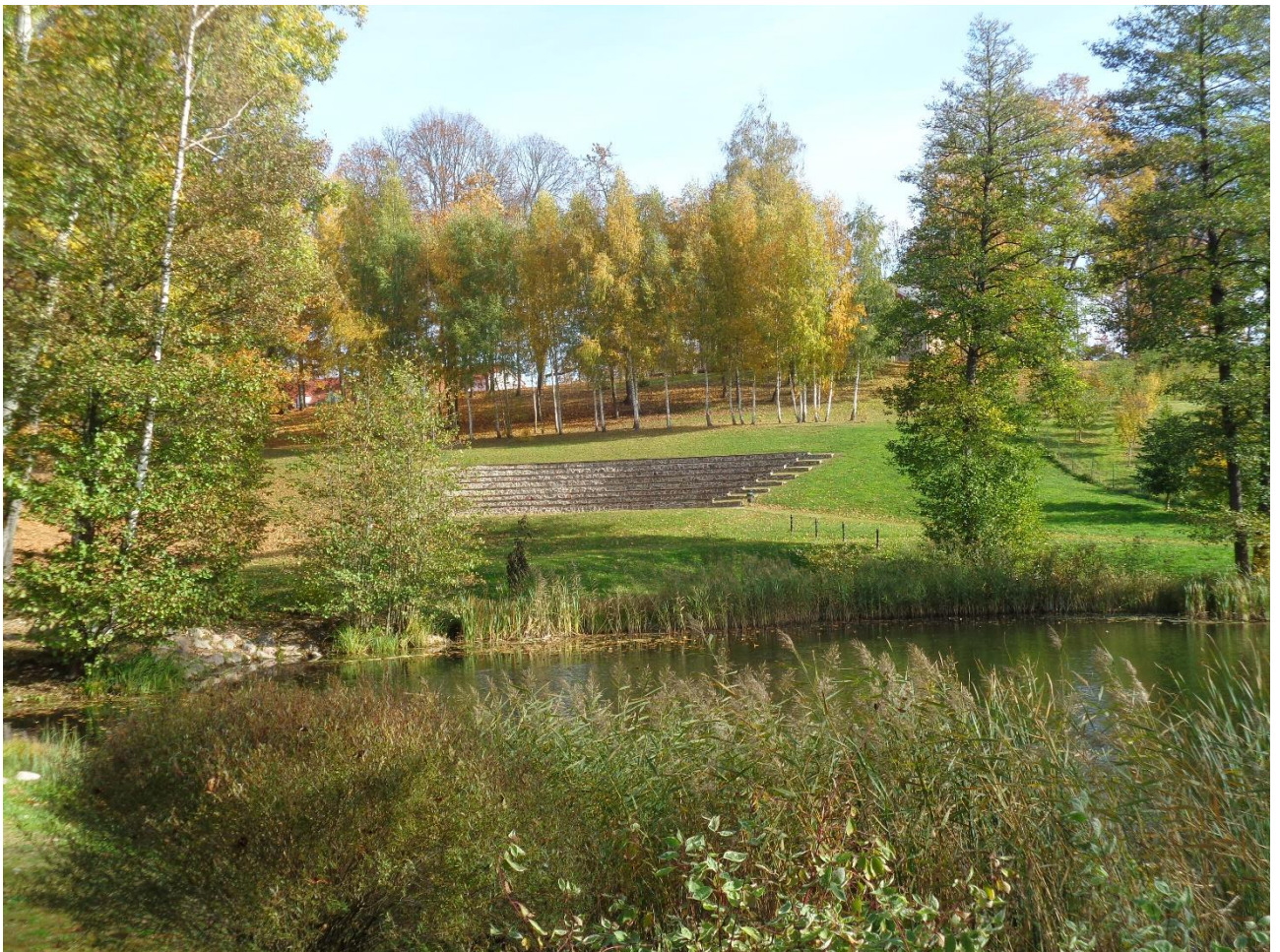
Prie tvenkinio lauko estrada

Įdomu, kad išilgai viso Ilgio ežero eina Lietuvos – Latvijos siena. Anksčiau dalis dvaro žemių buvo dabartinės Latvijos teritorijoje.