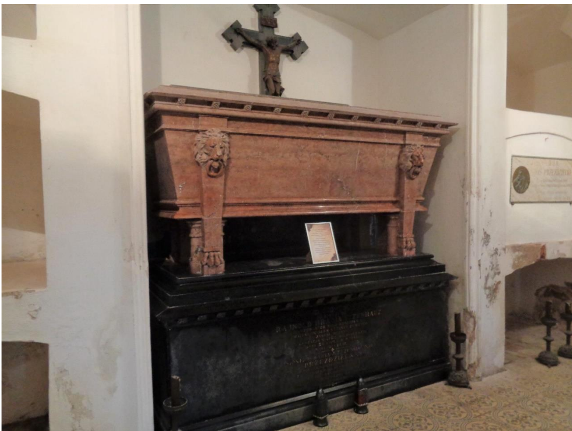
Grafo Reinholdo Tyzenhauzo palaidojimo vieta