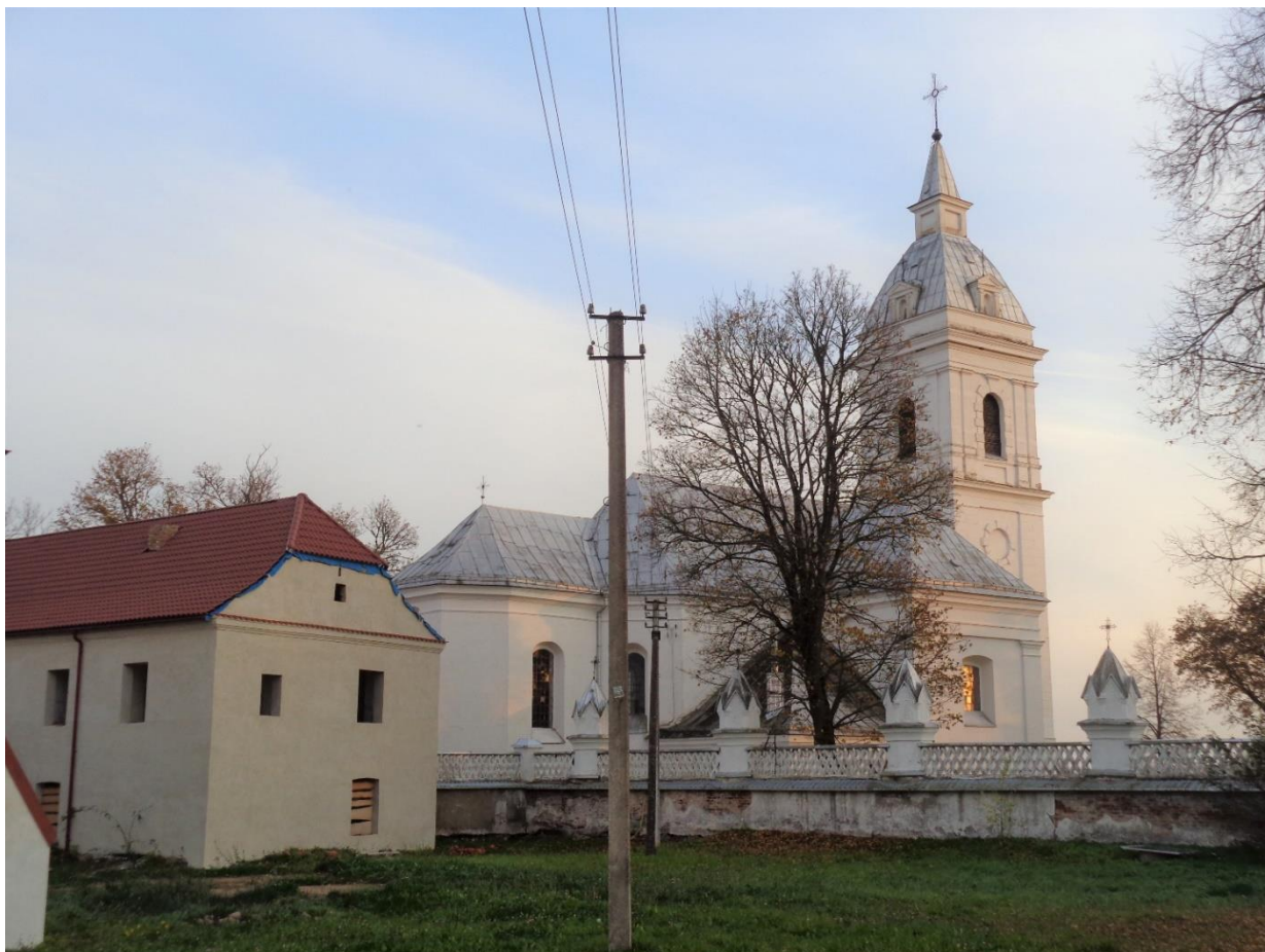
Palēvenės Šv. Dominyko baņņyčia

Dēl baņņyčios prižiūrētojos ligos neturējome galimybės patekti į Palēvenės Šv. Dominyko baņņyčią. Galējome tik pasigrozēti baņņyčios pastatu iš išorēs.